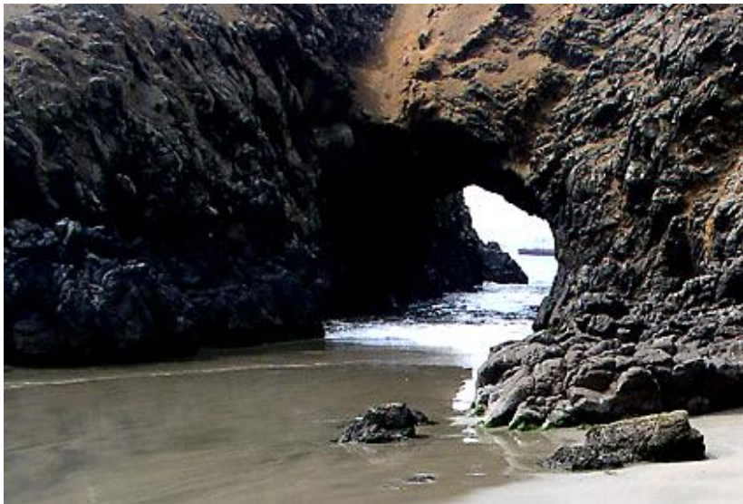
Foto del hotel Casa Isidora

Está un poco más al sur de la playa Lampay y el acceso es por Caleta Vidal. Si se va en transporte público, se recomienda tomar un taxi en Caleta Vidal. Tiene muchas cuevas y formaciones rocosas.